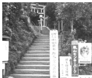
モンキーパーク入口

歩きました。新緑の葉桜が美しく、春から初夏へ移る季節を感じさせます。やがて岩田山自然遊園地に到着し、入山料800円を払って登山道を登り始めました。石段や坂道が続きますが、