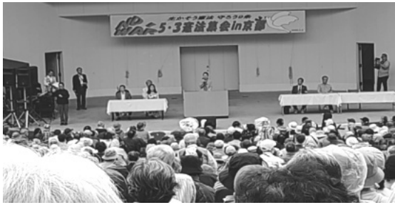
▲中野晃一上智大教授の講演

憲法記念日の5月3日、東山区の円山公園野外音楽堂で「生かそう憲法・守ろう9条 5・3憲法集会」が開かれました。小雨がぱらつく中でしたが、会場を埋め尽くした約2800人（主催者発表）の市民が、平和と憲法を守る思いを共有しました。