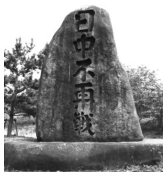
中ノ島・日中不戦碑

車内や嵐山周辺は外国人観光客で大変な賑わいでした。外国語が飛び交う中、一行は桜が散った後の嵐山公園を