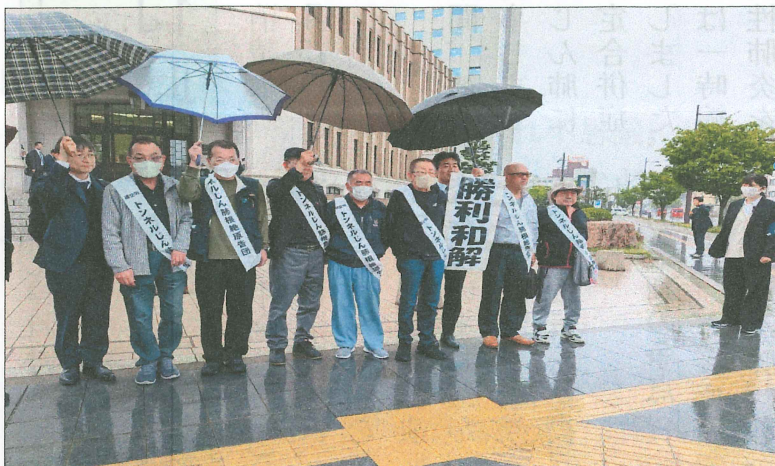
福井地方裁判所前で喜びの旗出しを行う原告団・弁護団