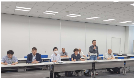
九段下合同庁舎11階会議室で開催されました

東京都本部は、バスとトラックの労働条件改善を求めて春の労働局交渉を行いました。トラック業界の長時間労働や改善基準告示違反の課題について労働局は「働き方改革による残業時間規制が個々の職場単位では解決出来ない」と実感している。荷主含めて業界を変えていく必要があると感じている。要請内容を本省(厚労省)に伝えます」と回答。バスの課題として会社が変形労働制を採用しているにも関わらず残業が常