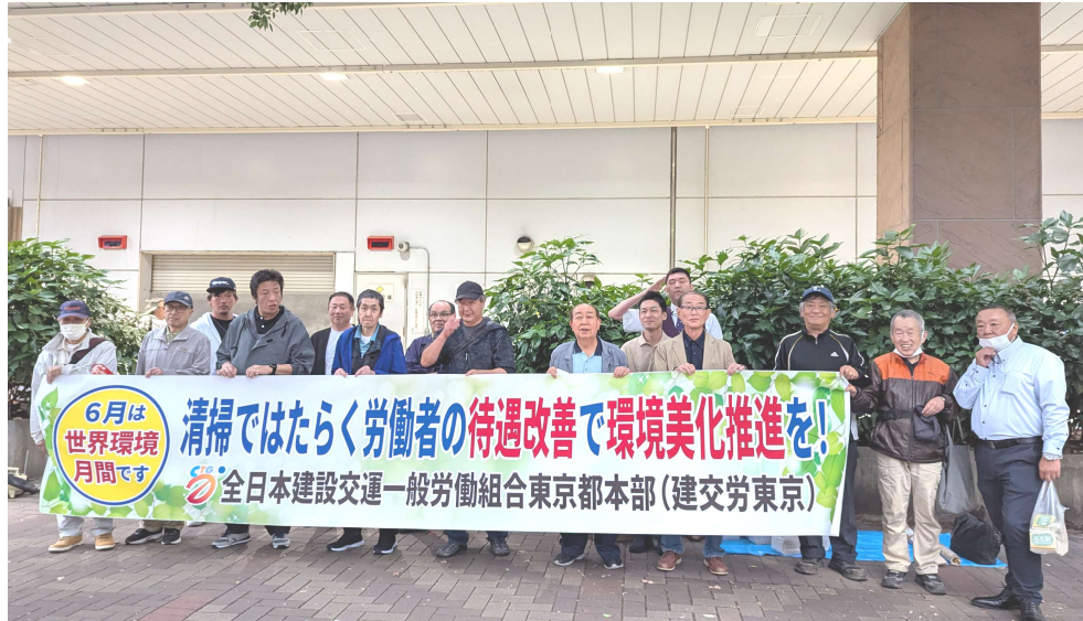
鉄道東京地本・関東支部・事業団高齢者部会の仲間が訴えました

清掃関連の職場ではたらく労働者の待遇改善で綺麗な駅・公園・都市を実現しよう。労働組合に加盟して職場改善、業界改善を一緒に実現しよう。